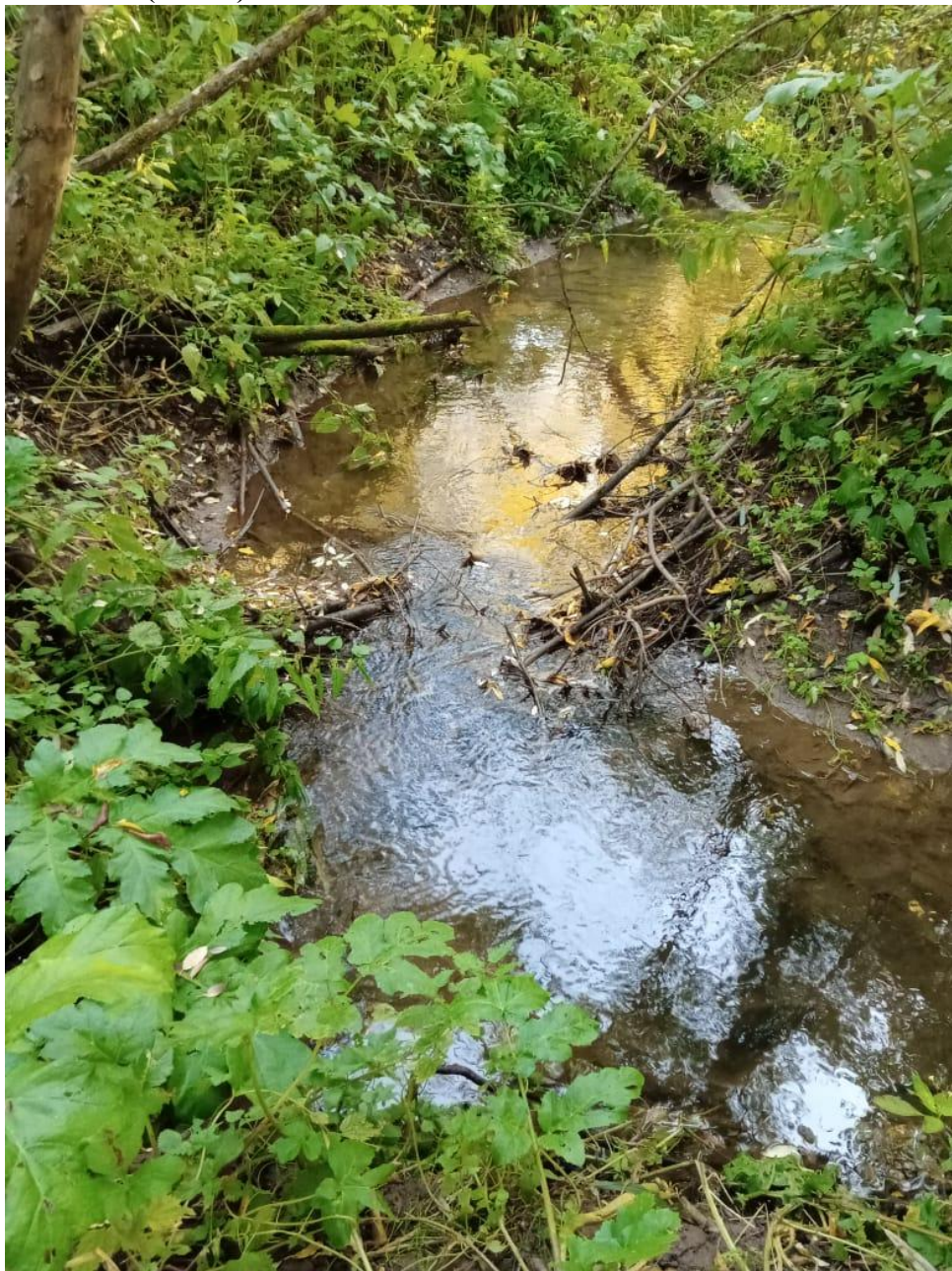
Река Ива (исток)