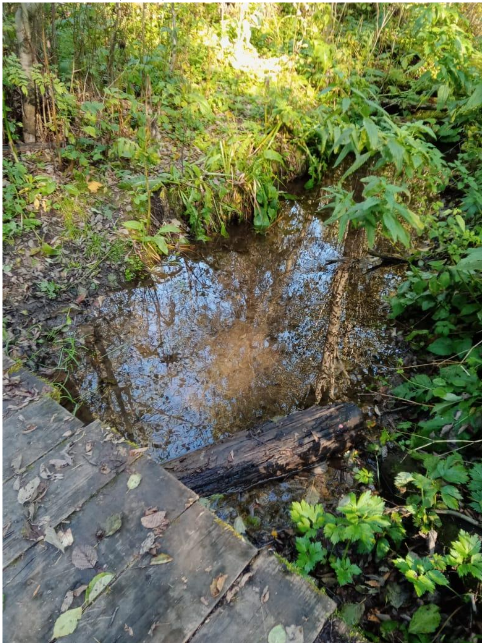
Река Данилиха (исток)