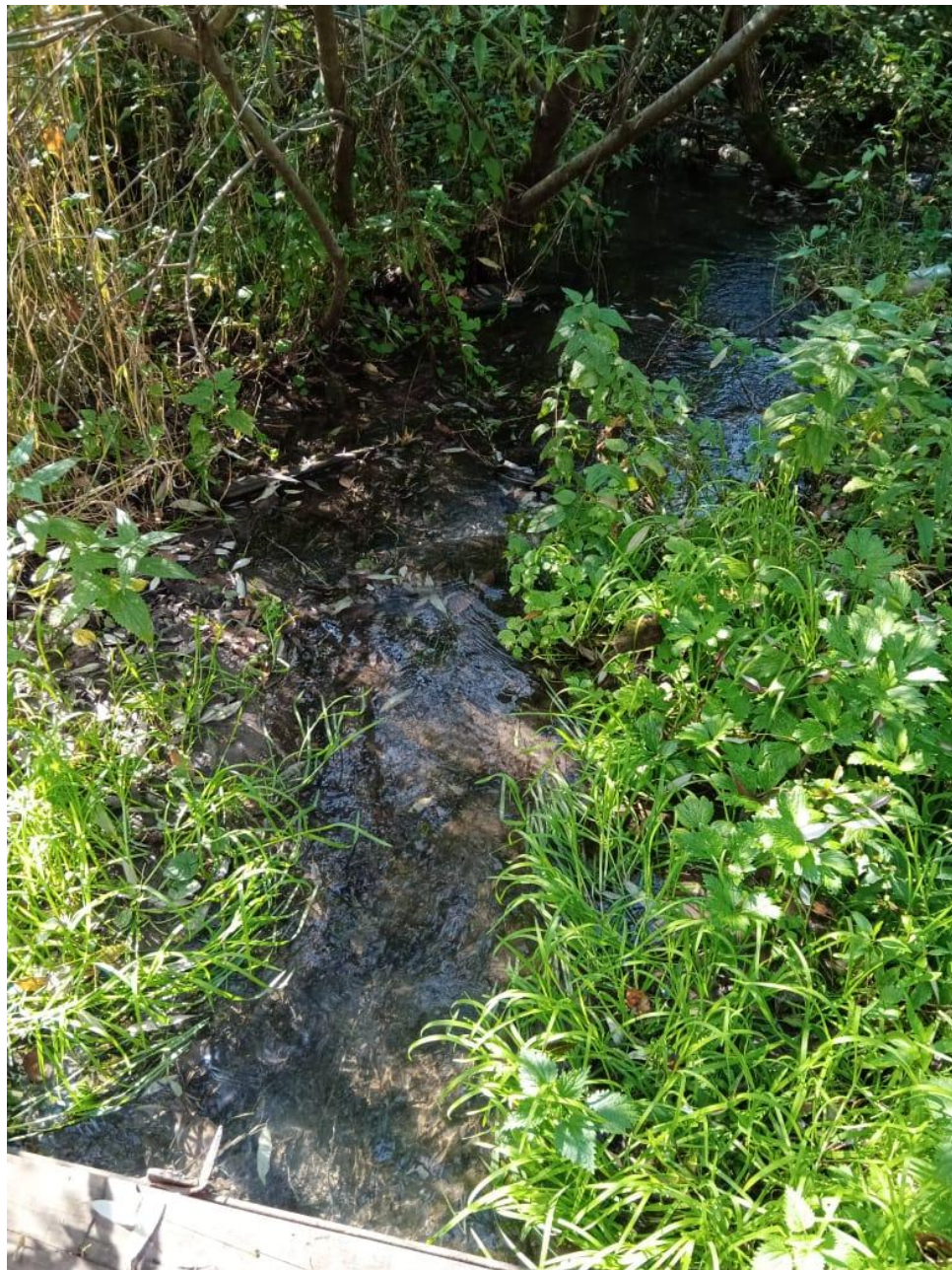
Река Егошиха (исток)