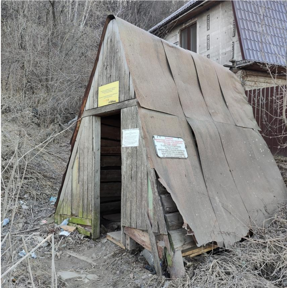
Родник- ул. Соликамская, 94 (98)